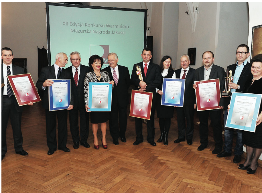
Laureaci XII edycji konkursu Warmińsko-Mazurska Nagroda Jakości