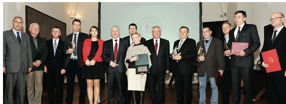
Laureaci VIII edycji konkursu Najlepszy Produkt i Usługa Warmii i Mazur