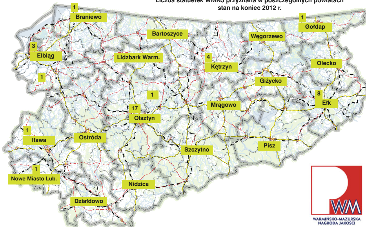
Liczba statuetek WMNJ przyznana w poszczególnych powiatach stan na koniec 2012 r.

Komitet może też przyznać nagrody specjalne - do dwóch statuetek za popularyzację w regionie problematyki Zarządzania przez Jakość.